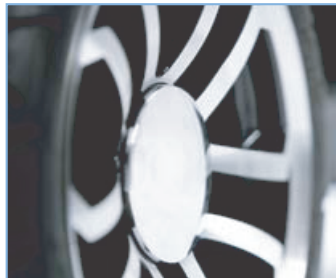
'CUCHILLAS' EN LAS RUEDAS