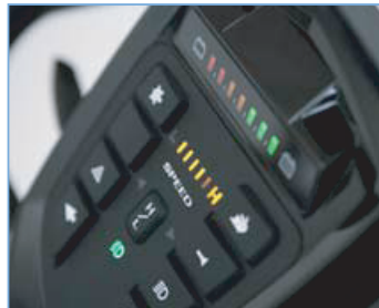
ESTADO DE CONTROL