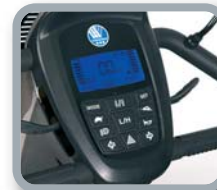
Cuadro de mandos electrónico

Scooter de 4 ruedas resistente y cómodo, ideal para uso en exteriores. Se puede programar electrónicamente.