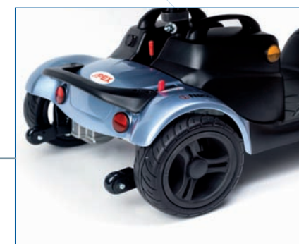
Palanca de desembrague y ruedas antivuelco