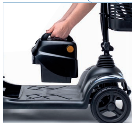
Baterías extraíbles para facilitar su recarga