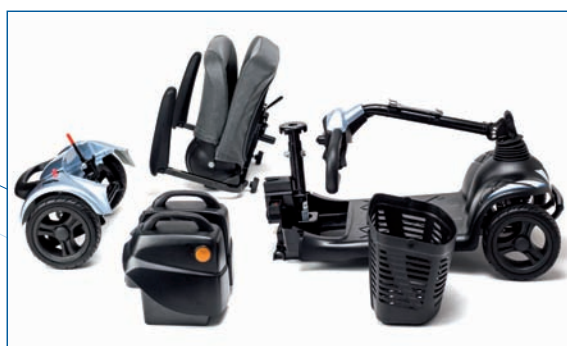
Desmontable en 4 piezas