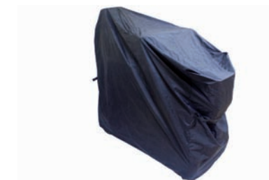
04060552: Funda de almacenaje