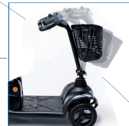
Columna de conducción