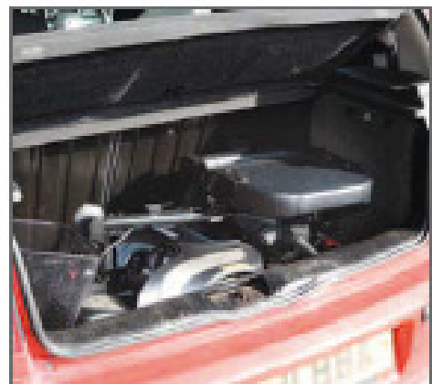
SE DESMONTA FÁCILMENTE PARA QUE ENTRE INCLUSO EN MALETEROS PEQUEÑOS