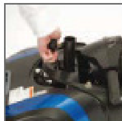
CONECTOR INALÁMBRICO BAJA EL MANILLAR